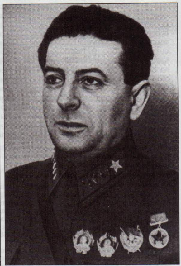
Л. З. Мехлис.

Красную гвардию от буржуазного тобы встать во победа рабочих вооруженное уазии, меньше- в. ПОБЕДИЛА я (7 ноября) глась к послед- оруженной руюой ачно. Мировая о рабочих шло и меньшевиков Многие Советы к большевиков. расная гвардия. тельного Собра-