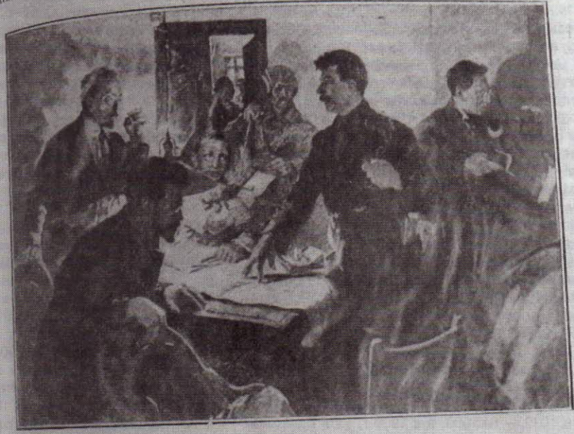
Боевой центр по руководству Октябрьским восстанием 1917 года.

войска. ный комитет партии большевиков создает боевой центр по