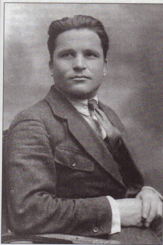
С. М. Киров. 1919 г.

так как их расстреляли в ходе работы. Однако один вопрос требует обсуждения: почему именно учебник А. В. Шестакова признали лучшим? Судя по архивам Кремля, явного фаворита не существовало, на все тексты были получены отрицательные рецензии, да и первую премию никому не присудили. Тем не менее в постановлении Политбюро от 27 августа 1937 года недвусмысленно указывается, что других в марксистском духе написанных учебников нет и поэтому краткий курс истории СССР под редакцией Шестакова целесообразно использовать и в старших классах средней школы 31 .